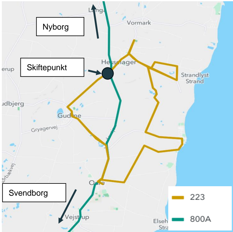
Figur 1: Rute 223 og rute 800A i området omkring Gudme

Figur 1 viser kort med rute 223 og rute 800A.